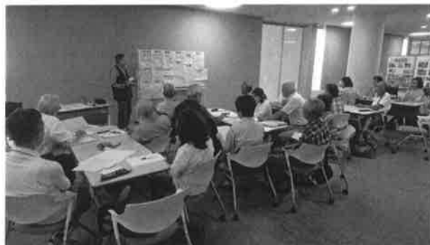
まちサポ会議の様子

発足から 5 年が経ち、これまでの行政事務局への依存から自立への道筋を模索する形で、登録会員が年 3 回集まる「まちサポ」会議を担当。自立に向けた話し合いと、自ら自立について考える「総務班」の設置、自らの活動を自ら発信するフェイスブックの立ち上げ等を支援した。