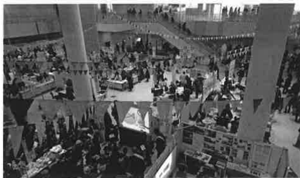
まちカフェの様子