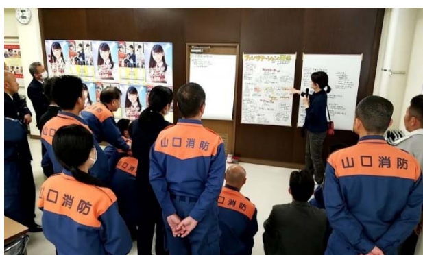
4/27 職員向け事前研修