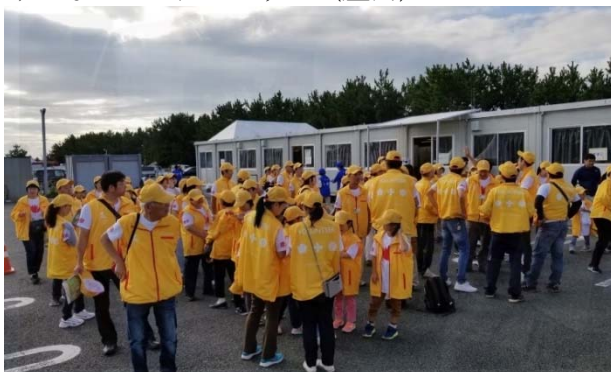
運営ボランティア（ボランティアセンター集合）