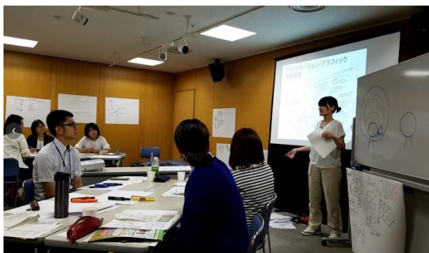
ファシリテーショングラフィック講座の様子1

女性や子ども、高齢者や障がい者、皆が安心して住めるまちづくりのために、今、何をすべきなのかについて、震災後、改めて考える時期となり、今までになかった新しい視点で、より良い復興を考えるワークショップを実施した。熊本県内のNPO、震災関連支援団体等約25名が参加。