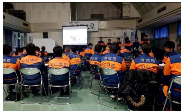
3/17 閉講式の研究発表