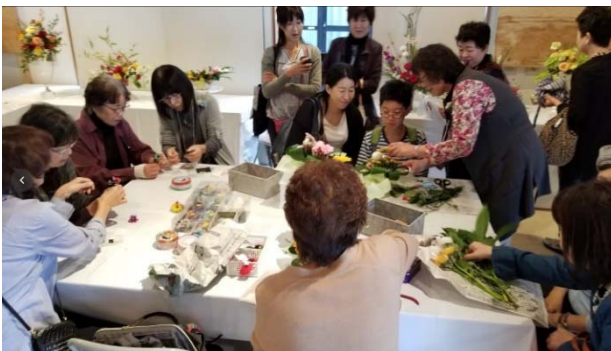
みんなのガーデンハウス（屋内）