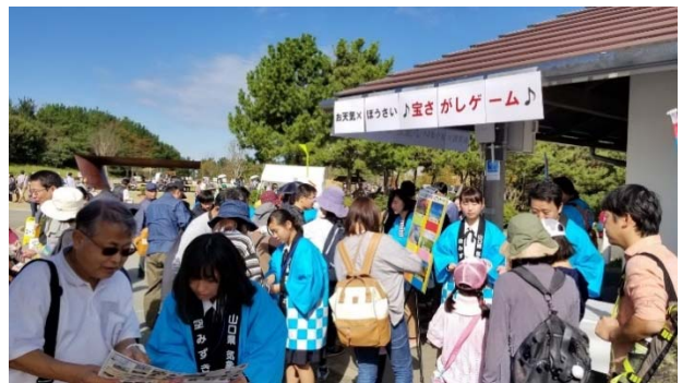
フリープログラム