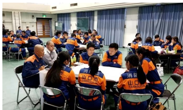
10/28 受講生向け研究テーマ検討