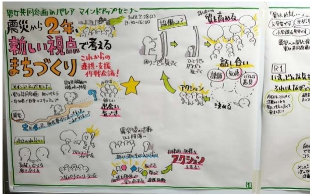
マインドアップセミナーの様子1