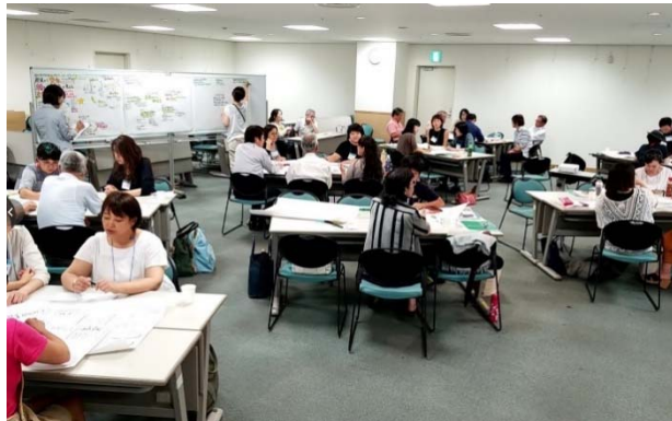
マインドアップセミナーの様子2