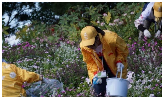
花管理支援ボランティア