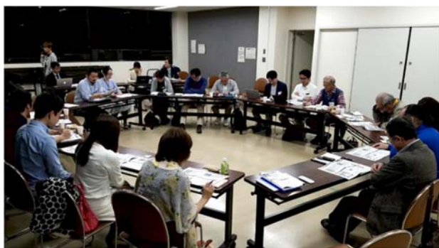
地域別作戦会議（説明会）